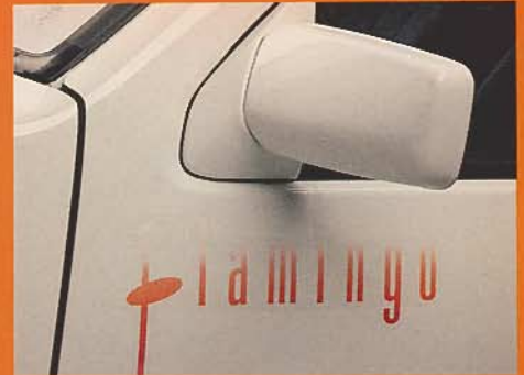
Außenspiegel und Stoßfänger in Wagenfarbe

D as ist neu: Der kleine Micra Flamingo mit dem groooßen Faltdach, das sich auf Wunsch elektrisch öffnen läßt. Ein Open Air Konzert auf Knopfdruck! Laß den Frust raus und die Welt rein, Flamingo! Oder der Micra Mouse mit dem Azurit-Glasdach (auf den Seiten 2 bis 3 abgebildet). Beide Micras gehören zu den luftigsten und bestausgestatteten Autos ihrer Klasse. Frontgrill, Radzierkappen und Außenspiegel sind in Wagenfarbe mitlackiert. Für Sie serienmäßig ohne Aufpreis.