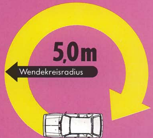
Stadtflitzer: Wendekreisradius 5,0 m

Prüfungsfach „Äußere Form“: Sehr gut. (Siehe Foto.)