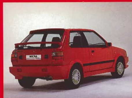
Optischer Leckerbissen: Micra, Rückansicht

(Auszug aus dem Micra „Personal-Tuning-Programm“.) Fragen Sie Ihren Nissan-Händler nach allen Möglichkeiten eines „Micra-Liftings“.