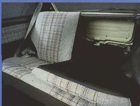
Serienmäßig – die geteilt umlegbare Rückbank

Diese Heckklappe ist bis zur Stoßstange heruntergezogen, die Ladekante des Kofferraumes daher entsprechend niedrig. Ihr Kreuz wird das sicherlich danken.