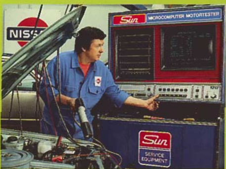
160 Nissan-Fachbetriebe in ganz Österreich.

Nissan hat in den letzten Jahren seine Servicequalitäten konsequent gesteigert. So hat Nissan als einzige japanische Automarke in Europa ein eigenes Zentralersatzteillager. Dadurch können beinahe 96% aller Ersatzteile innerhalb von 48 Stunden nach Österreich geliefert werden. Verkürzte Wartezeiten als echtes Service für jeden Nissan-Fahrer.