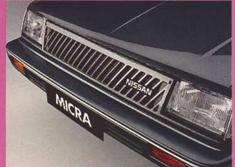
Gestylt: Diagonal-Frontgrill in Wagenfarbe

W enn die Stadt erwacht und die dicken Limousinen verzweifelt Parkplätze suchen, besteht der Nissan Micra eine Prüfung nach der anderen. Prüfungsfach „Ökonomie“: Sehr gut. (Verbrauch nach ECE-Norm bei 90 km/h 5,2l, bei 120 km/h 7,0l, im Stadtverkehr 7,8l Normalbenzin bleifrei.)