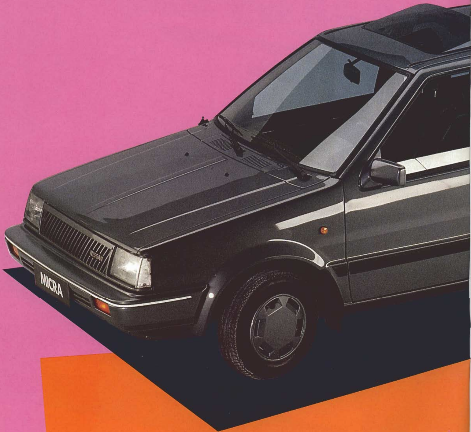
Nissan Micra Mouse, 5türlich mit Azurit-Glasdach