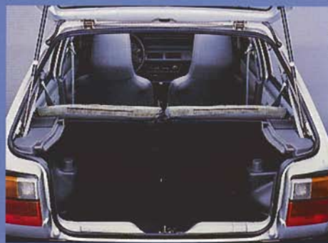
Die innere Größe mit variablem Stauraum

D as ist neu am Micra: Wahlweise laden jetzt gleich 5 Türen ein, noch bequemer einzusteigen. Wer Kinder hat, die Einkaufstasche schnell auf die hintere Sitzbank stellen will oder zu viert ausfahren möchte, wird diese Neuerung schätzen. Nur wenige Autos dieser Klasse werden in 5türiger Ausführung angeboten.