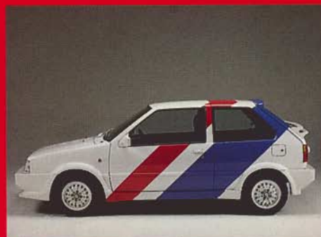
Individuell, unverwechselbar: Micra

E in Micra setzt Ihren Wünschen keine Grenzen. Im Gegenteil, er öffnet Ihnen neue Horizonte. Sie können Ihren persönlichen Micra schon jetzt im „Sonntags-Gewand“ bestellen. Einen Micra, wie nur Sie ihn fahren: